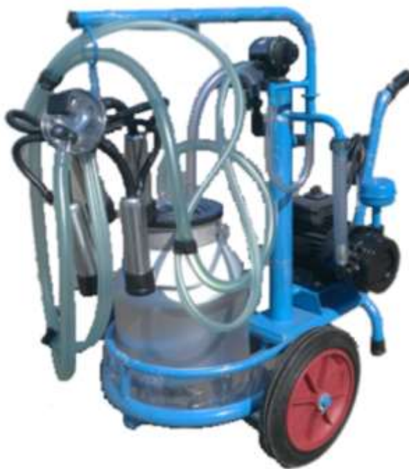
Рисунок 1 – Агрегат

Подключение агрегата производится к электрической сети переменного однофазного тока, напряжением 230В и частотой 50Гц через розетку. Эксплуатация без заземления не допускается.