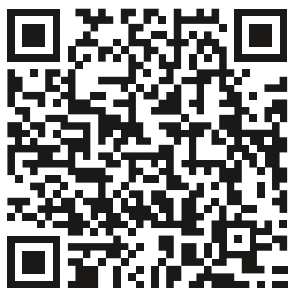
Green City e-ALFA New

Для того, чтобы просмотреть и скачать актуальную последнюю версию инструкции с техническими характеристиками, отсканируйте QR-код: